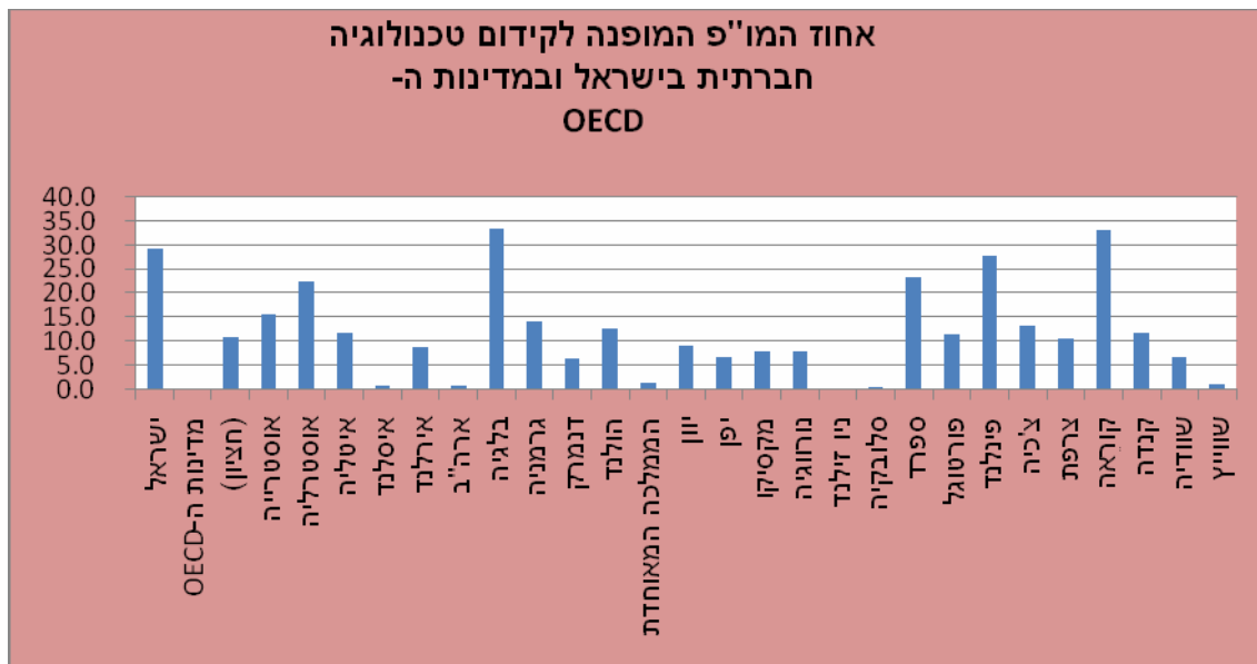
מקור: הלשכה המרכזית לסטטיסטיקה, מימון מו"פ ע"י משרדי ממשלה, בישראל ובמדינות ה-OECD, לפי יעד, מונחי 2007 לוח 23.