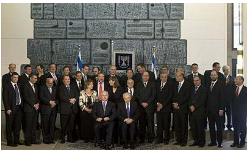
ישראל בתחתית הדירוג בגודל הוצאות הממשלה

יש להזכיר, כי בפרמטר המודד את גודל ההוצאה הממשלתית נכללות כלל הוצאות הממשלה. כלומר, הוצאות ביטחוניות גבוהות, כמו שיש ודאי למדינה כמו ישראל, או השקעה ממשלתית בחינוך ובביקודם שכבות חלשות, פוגעות בדירוג החופש הכלכלי של מדינה.